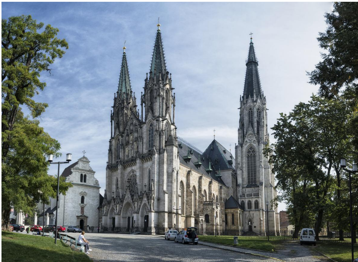
Chrám svatého Václava

Na rohu ulic Na Hradě a Mahlerovy stojí kaple svatého Jana Sarkandra. Kněz Sarkander, který zde byl v 17. století vězněn a mučen kvůli zpovědnímu tajemství a podezření ze špionáže, byl v roce 1995 svatořečen papežem Janem Pavlem II. přímo v Olomouci. Procházku centrem dotváří unikátní soubor barokních kašen s mytologickými motivy ze 17. a 18. století. V historickém jádru jich napočítáte hned šest: Caesarovu, Herkulovu, Jupiterovu, Merkurovu, Neptunovu a kašnu Tritonů.