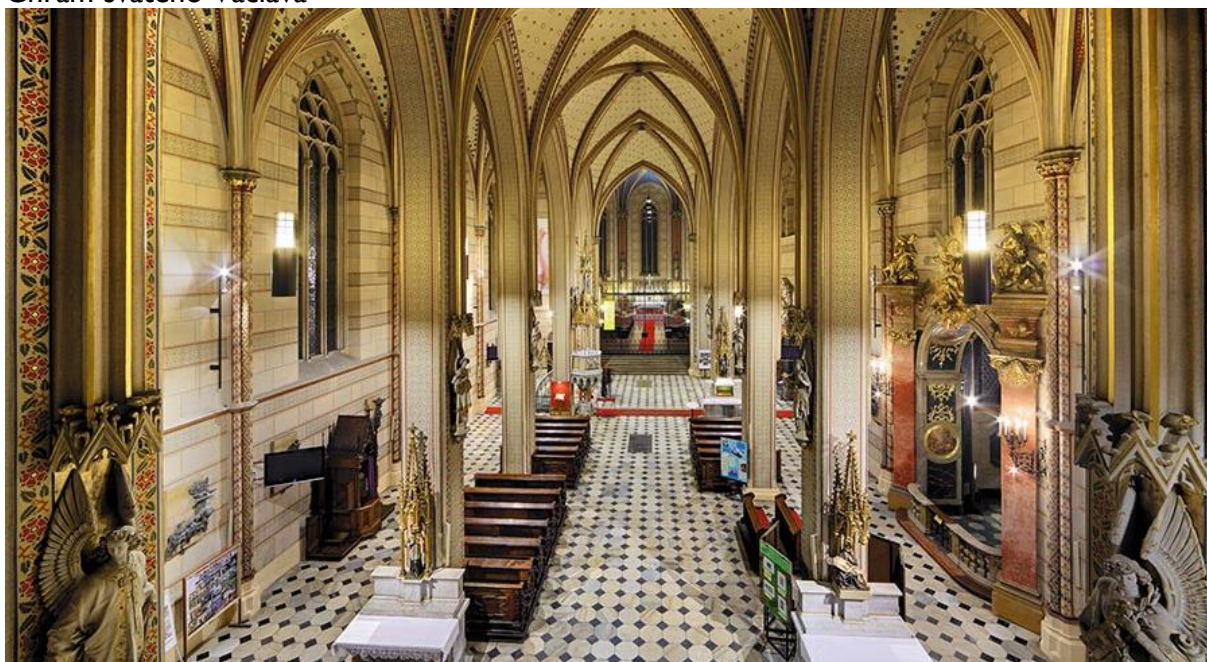
Chrám svatého Václava