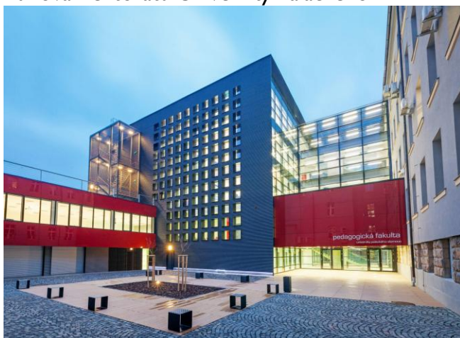
Budovy Pedagogické fakulty Univerzity Palackého