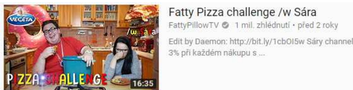
Obrázek č. 3: Pizza Challenge – youtuber FattyPillow

Dalším druhem videí jsou tzv. challenge, česky výzvy, prostřednictvím kterých se plní nejrůznější, mnohdy dosti absurdní, úkoly (Já, JůTuber 2015). Pro ilustraci uvádíme jen pár z nich. Pizza Challenge – youtuber FattyPillow si před kamerou vylosuje deset absurdních ingrediencí typu gumových medvídků, sardinek, čokolád, vanilkového cukru apod., ze kterých musí „uvařit“ pizzu a tu pak před kamerou sníst viz obrázek č. 3. Youtuber GoGo přišel s výzvou nazvanou Depilation! , při které se nechal před kamerou depilovat svým kamarádem pomocí voskových pásků (GoGoManTV 2014). Diaper Challenge , neboli Plenková výzva, se provádí ve dvou lidech. Každý má tři papírové pleny, do kterých umístí nějaké jídlo. Pleny dá následně ohřát do mikrovlnné trouby. Ohřáté pleny si vymění, ochutnají jejich obsah a hádají, co za pokrm se v nich nachází (MamaLifestyle 2015).