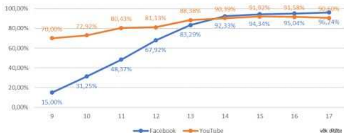
Graf č. 2: Využívání YouTube a Facebooku (dle věku dítěte)

V 10 letech věku dítěte využívá YouTube dvakrát více dětí než Facebook, rozdíl ve využívání obou serverů se vyrovná zhruba ve 14 letech věku dítěte. Děti v drtivé většině preferují videa vytvářená youtubery - zejména tzv. letsplaye (záznamy z hraní počítačových her), zábavné videokanály (vtipy, humor), dívky pak sledují videokanály zaměřené na módu (fashion). Srovnání využívání obou služeb u dětí ve věku 9-17 let zachycuje následující graf.