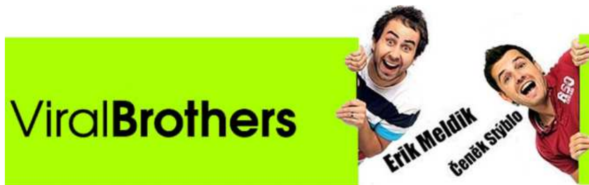
Obrázek č. 4: Dvojice ViralBrothers

Pranky jsou žertovná videa, která slouží k pobavení publika prostřednictvím nic netušící oběti (Já, JůTuber 2015). Youtuberovi, který tato videa natáčí, se říká prankster a podstatou takového videa je někoho nachytat, vyděsit, případně rozčítit. Velmi známou dvojicí, která natáčí pranky je ViralBrothers viz obrázek č. 4. V zahraničí je velmi známým youtuberem natáčeji pranky Jesse Wellens viz obrázek č. 5.