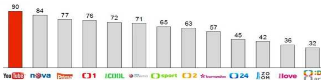
Graf č. 1: Sledovanost YouTube oproti jiným kanálům u jedinců 15 – 24 let

V České republice je cca 5,2 milionu unikátních diváků měsíčně. Měsíčně tito diváci zhlédnou 1,9 miliardy videí. Téměř 50 % zhlédnutých videí připadá na mobilní zařízení, což demonstruje jejich velkou oblíbenost, a to zejména u jedinců mezi 15 – 24 lety, na něž připadá až 90 % měsíční sledovanost YouTube oproti jiným kanálům viz graf č. 1. Průměrná týdenní doba sledování videí u jedinců 15 – 24 let činí 175 minut (Smrž 2017).