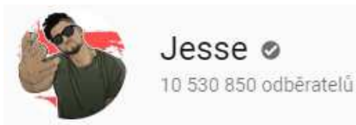
Obrázek č. 5: Kanál youtubera Jesse Wellense

Sketche jsou krátké a zábavné scénky (Já, JůTuber 2015). Zpravidla jsou natáčeny podle nějakého scénáře a nezřídka v nich vystupuje více postav (například MadBros).