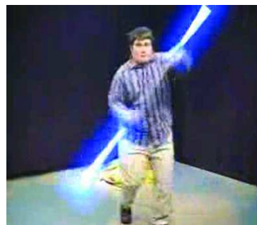
Obrázek č. 1, 2: Ukázka z originální a upravené nahrávky

Původní videoukázku můžete nalézt zde: http://www.youtube.com/watch?v=HPPi6vilBmU