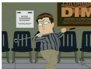
Obrázek č. 3: South Park – epizoda Canada on Strike

Mimo upravené videoukázky vznikla i řada parodií ve známých animovaných seriálech jako např. South Park, American Dad apod. viz obr. 3, 4.