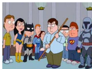
Obrázek č. 4: American Dad – epizoda All About Steve