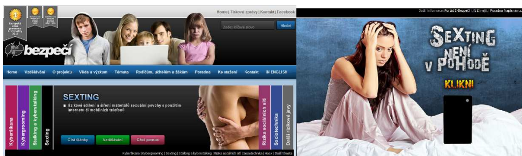
Obrázek č. 4, 5: Stránky projektu E-Bezpečí ( www.e-bezpeci.cz ) a portálu Sexting není v pohodě ( www.sexting.cz )

Podrobnější informace naleznete na stránkách projektu E-Bezpečí ( www.e-bezpeci.cz ) nebo na portále Sexting není v pohodě ( www.sexting.cz ).