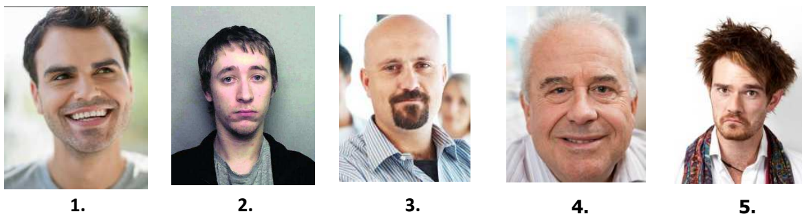
Obrázek č. 2: Identifikujte kybergroomera

Pokud si uděláme malý test a pokusíme se na níže uvedených fotografiích (obrázek č. 2) dle vzhledu vytipovat sexuálního útočníka, tak zjistíme, že jím může být opravdu v podstatě kdokoliv. Mezi jedinci na fotografiích je umístěn skutečný sexuální útočník.