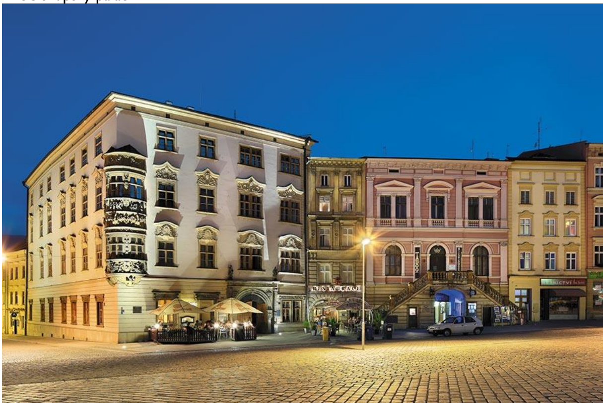
Dolní náměstí v Olomouci