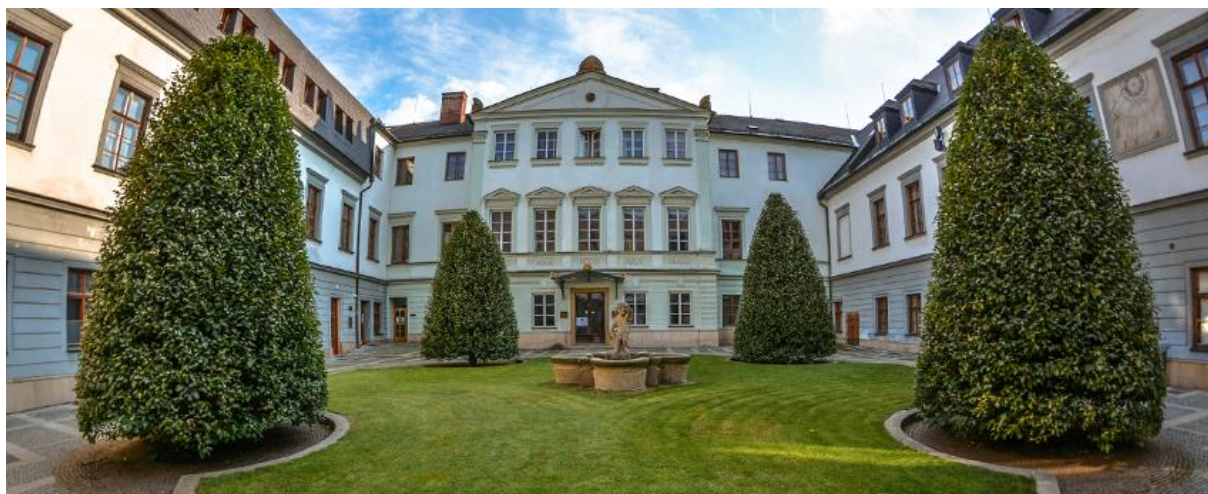
Budova Rektorátu Univerzity Palackého

Dnes patří Univerzita Palackého v Olomouci, reprezentovaná osmi fakultami k prestižním českým vysokým školám. Představuje moderní vzdělávací instituci se širokou nabídkou studijních oborů a bohatou vědeckou činností. Na jejích osmi fakultách studuje 20 395 studentů v akreditovaných studijních programech (údaj z roku 2017). Univerzita Palackého patří podle mezinárodních žebříčků mezi nejlépe hodnocené české univerzity a vede si velmi dobře i ve srovnání se zahraničními univerzitami.