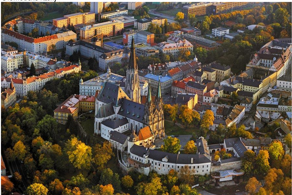
Pohled na chrám svatého Václava s budovou Pedagogické fakulty Univerzity Palackého v pozadí

Více informací na: www.upol.cz a www.visitolomouc.cz