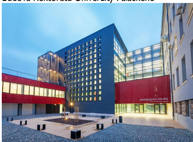
Budovy Pedagogické fakulty Univerzity Palackého