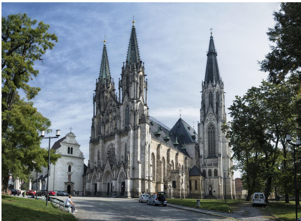
Chrám svatého Václava

Olomoucké kašny – soubor barokních kašen s mytologickými motivy ze 17. a 18. století; v centru města jich najdete hned šest – Caesarovu, Herkulovu, Jupiterovu, Merkurovu, Neptunovu a kašnu Tritonů.