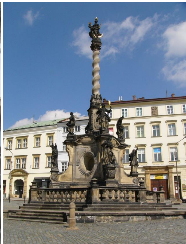
Olomoucký orloj a Mariánský sloup