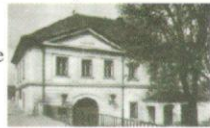
Hostinec U kaštanu v Břevnově

Uvedením Smetanovy Libuše bylo v Praze otevřeno Národní divadlo 18.11.1883