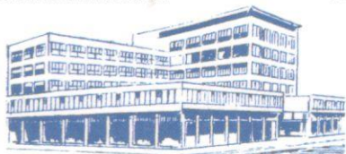
Všeobecný penzijní ústav

Začátek hospodářské krize v ČSR (vrchol na jaře 1933) 1930 Začala mostecká stávka 23.3.1932