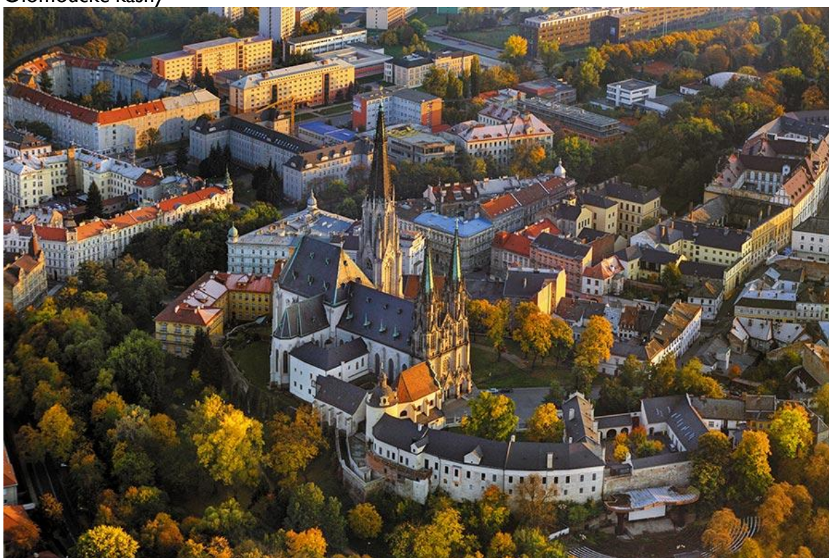
Pohled na chrám svatého Václava s budovou Pedagogické fakulty Univerzity Palackého v pozadí

Více informací na: www.upol.cz a www.visitolomouc.cz