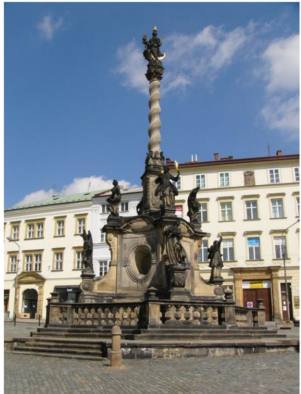
Olomoucký orloj a Mariánský sloup