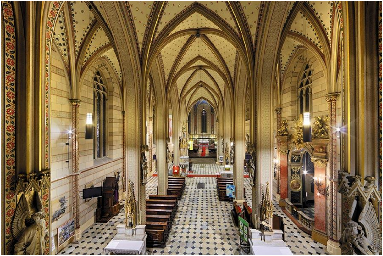
Chrám svatého Václava